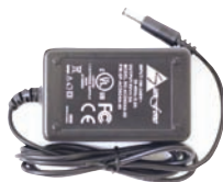
Блок питания для AmiNET130M

AmiNET130M поставляется со следующими аксессуарами: